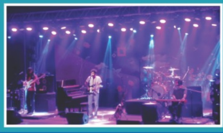
Prateek Kuhad Winter Tour