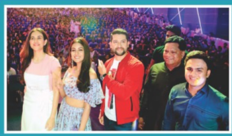
'SETTERS' Movie Promotion