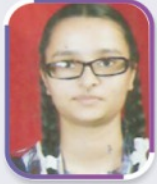
यशस्वी 90.40% • XII Arts, 2012 2nd Rank in Jaipur