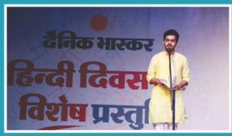
'Shabd Bhaskar' by Dainik Bhaskar