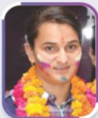
मुस्कान लोकण्डा वाणिज्य 91.20%