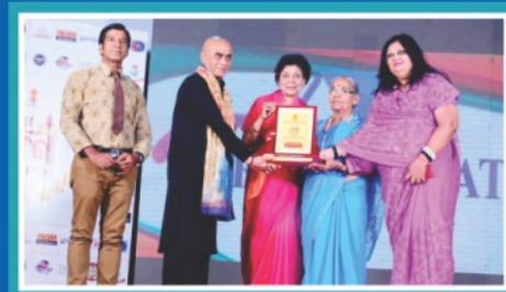
Jaipur Ratna Samman Samaroh