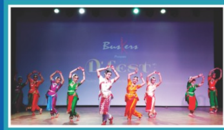
D-Fest 2019 Pre Round