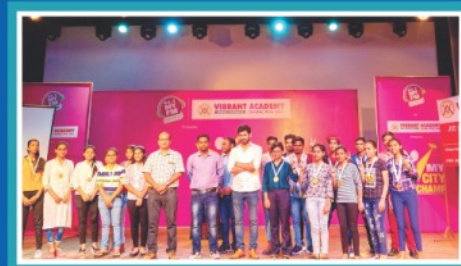
'My City Champ' by 94.3 FM