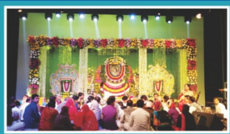
Shyam Bhajan Sandhya