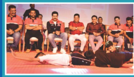
Jaipur Pink Panther Promotion