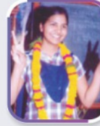
आर्कोशा उदय 94.92% • XII Sci. 2011 10th Rank in Rajasthan