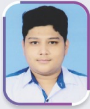
स्पर्श गुंसाई 93%